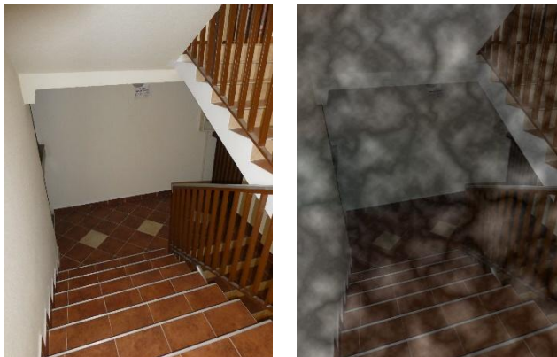
1. kép: Menekülési útvonal, a keletkező füst látást korlátozó hatása