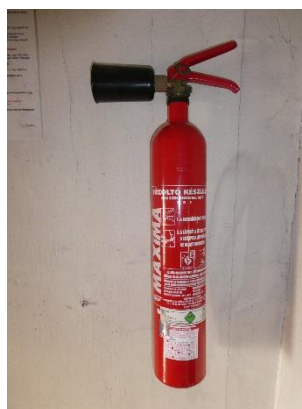
3. kép: Hordozható tűzoltó készülékek különböző típusai