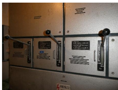
5. kép: A lépcsőházankénti tűzeseti főkapcsolók