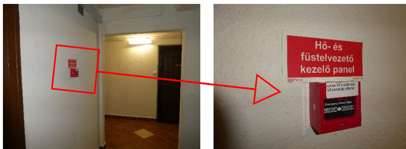
2. kép: Hő- és füstelvezetést, menekülést biztosító távnyitó